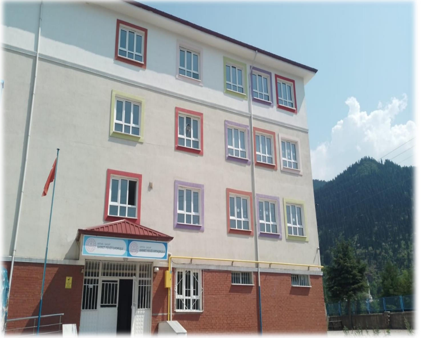
AHMET FEVZİ İLK/ORTA OKULU

Şavşat Ahmet Fevzi İlk/Ortaokulu , 2024-2028 Stratejik Planı hazırlanırken Stratejik Plan Hazırlama ekibi olarak bu alan da Müdürlüğümüzün Tarihsel Gelişimi, Yasal yükümlülükleri ve Mevzuat Analizi, Faaliyet alanları – ürün ve hizmetlerin ilişkilendirilmesi, paydaş analizi ve Kurum içi ve dışı analizler yapılmıştır.